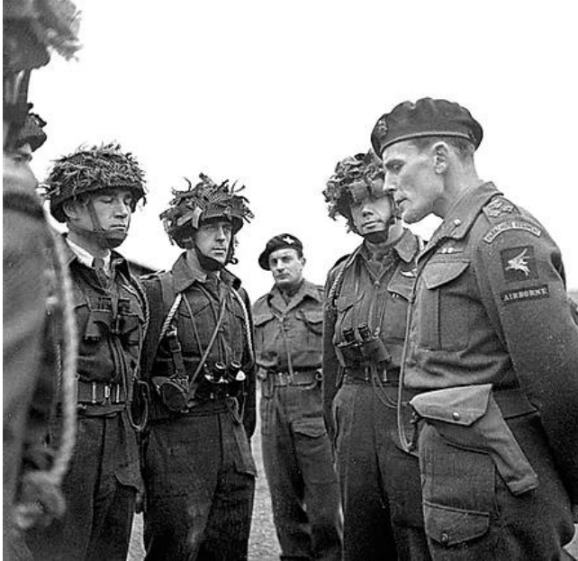
Lt-Col Jeff Nicklin, 2 e van rechts.

Om ongeveer 10.00 uur die ochtend van de 24 e , springt Jeff als commandant uit de Dakota in de omgeving van Bergerfurth. Hij landt in een klein boscomplex midden op de DZ-A, (Dropping Zone-A, zie overzichtskaartje), komt met zijn parachute vast te zitten in een boom en wordt nog voordat hij voet op de grond kan zetten doodgeschoten.