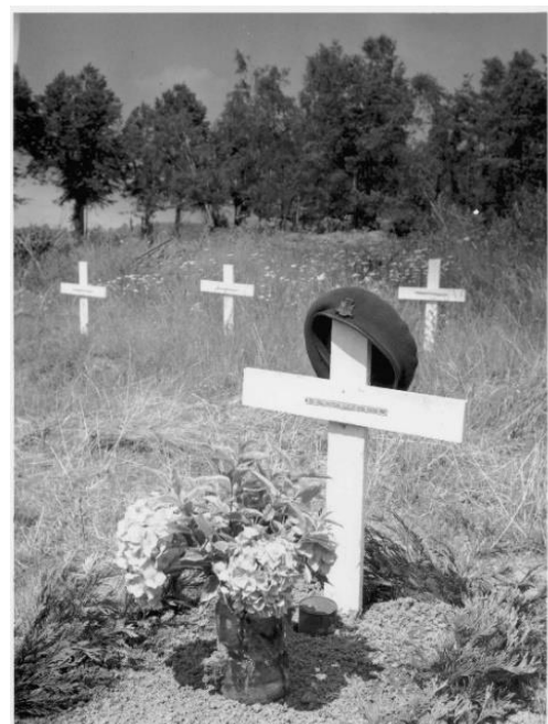
Zijn tijdelijk graf.

Hij wordt tijdelijk begraven in Bergerfurth bij Essen.